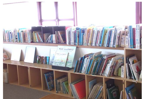
紹介の絵本は全て館蔵です(写真：4階絵本コーナー)